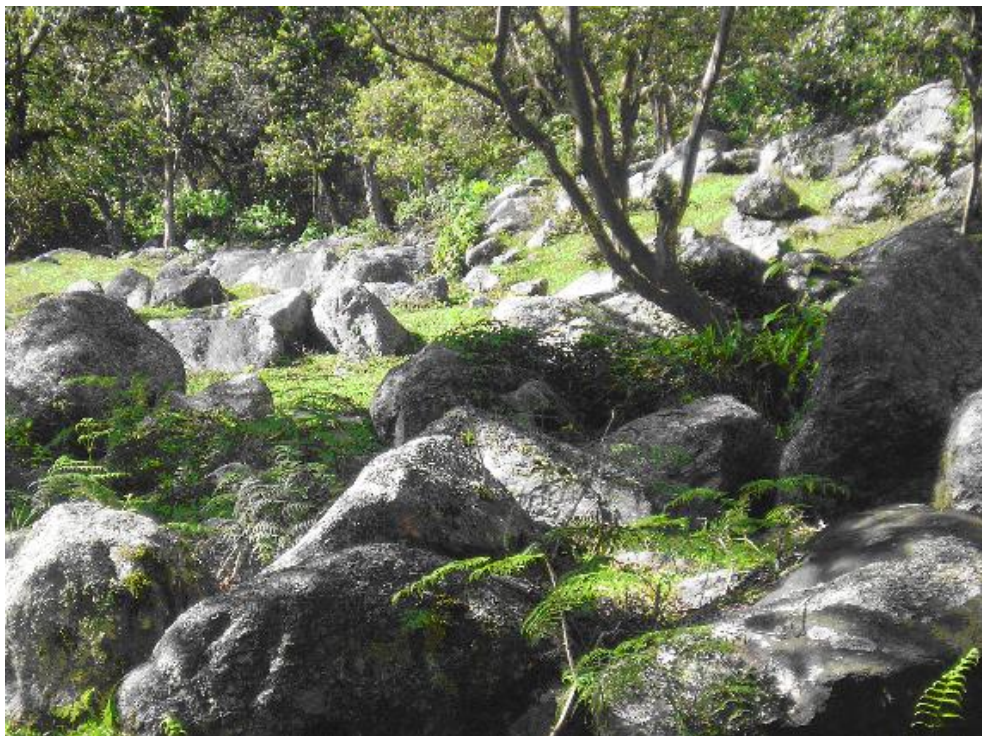
MEGABLOQUES RELACIONADOS CON AVALANACHAS, SECTOR EL MINUAL , ESTADO MERIDA